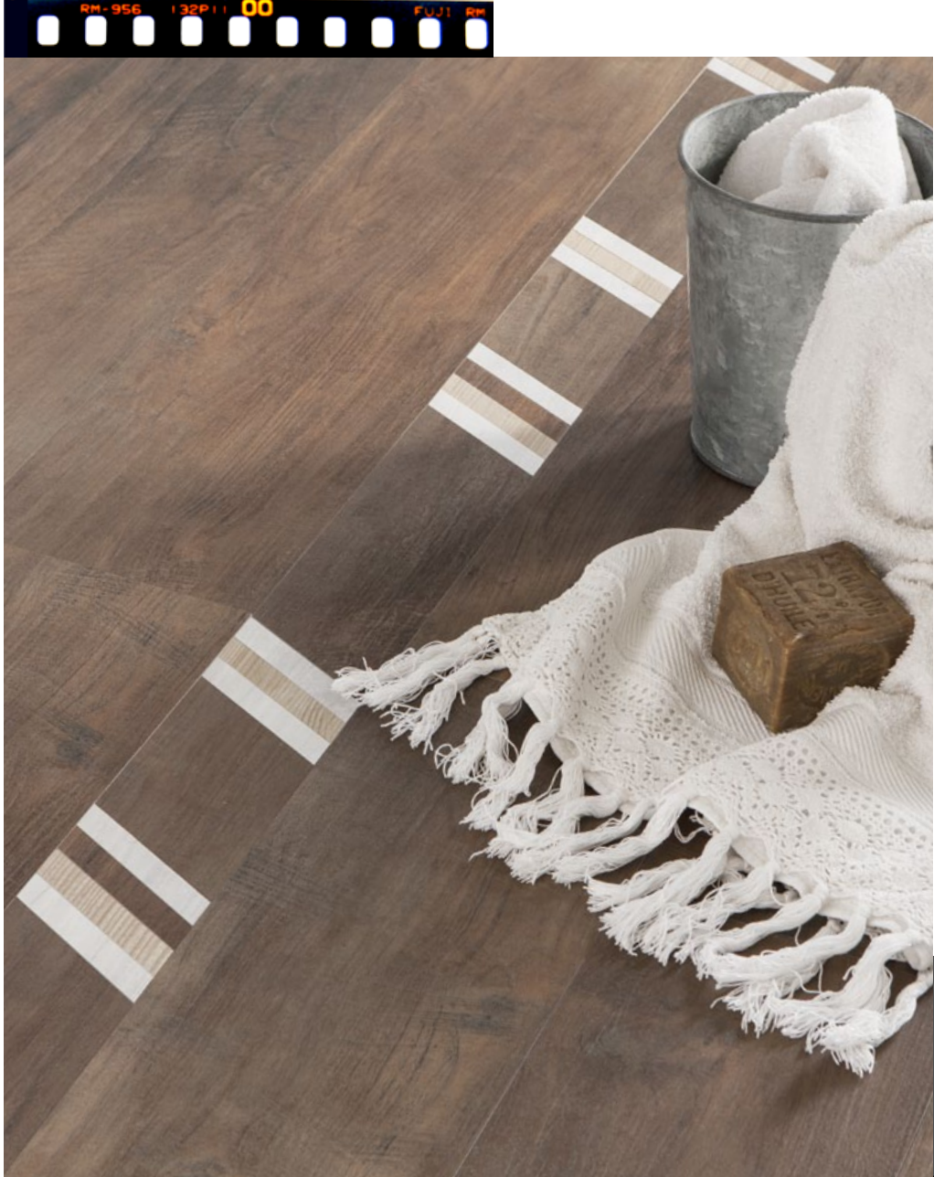
Cenefa Stripe Dock 9,5 x 49,8